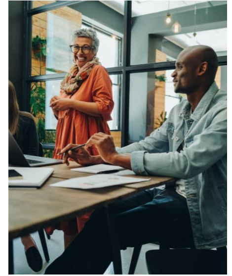
People Advisory Services