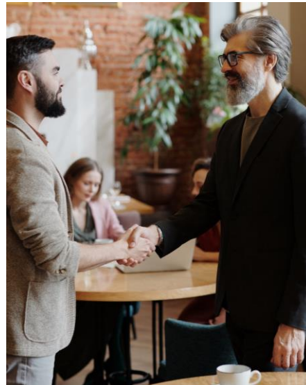
Strategy and Transactions