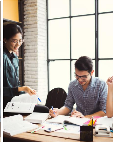
Tax & Law